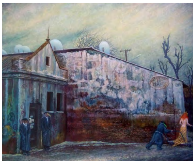
Ю. Кох. Суботник, олія на полотні, 40 x 55 см, 2020

роздумів про сенс буття — саме так народжується концепція, яку митець згодом видобуде з себе на полотні чи вирізьбить з каменю.