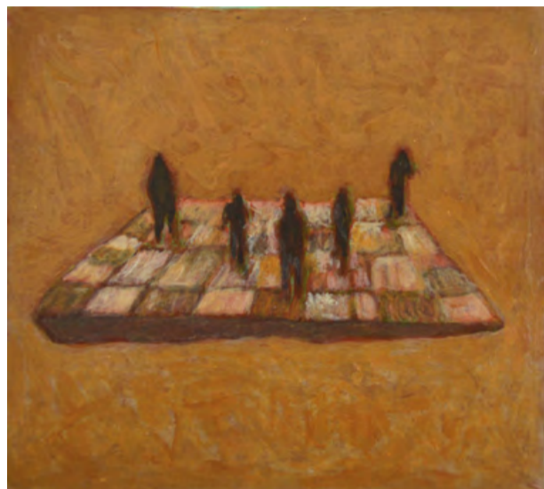
Herve Constant. ISOLATION, акрил на папері, 25 x 25 см, 2019 (Private collection, Basel, Switzerland)