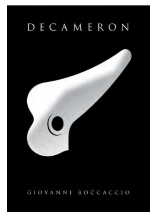
Микола Гончаров. Декамерон, плакат, цифровий друк, 100 x 70 см, 2020