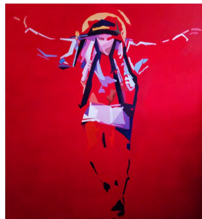
Мар'ян Лунів. Аркан. Розп'яття, олія на полотні, 200 x 180 см, 2020